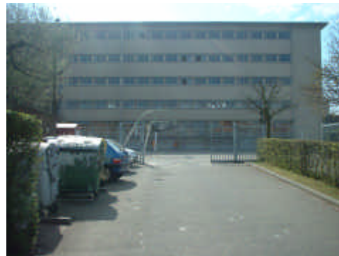
Le collège, avec l'ADBWSL, c'est comme si vous y étiez!